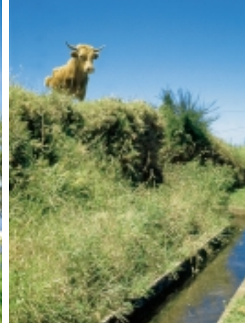
Wanderungen 34 und 41: Die Levada Calheta-Ponta do Pargo im Juli; rechts: manchen Anrainern gibt man Rätsel auf.